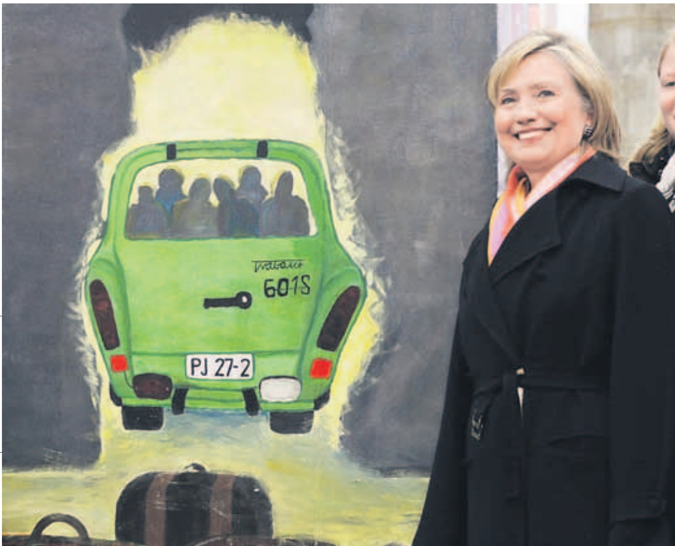
Rosen und Steine. An der Bernauer Straße fotografiert eine junge Frau durch die ehemalige Mauer, die Teil der Gedenkstätte ist. Und am Brandenburger Tor posiert Hillary Clinton, die US-Außenministerin, vor einem der Dominosteine, die am Abend umgestoßen wurden. Eine Schulklasse aus Brandenburg hatte den Stein für die US-Botschaft bemalt.